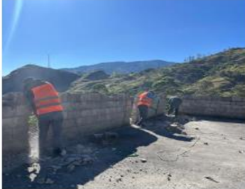
1.1 REPLANTEO Y NIVELACIÓN MANUAL PARA REMODELACIONES