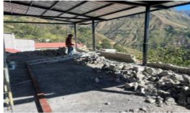
1.3 DESALJO DE MAT. SOBRIANTE D>1< = 5 KM. INC. CARG. MANO.