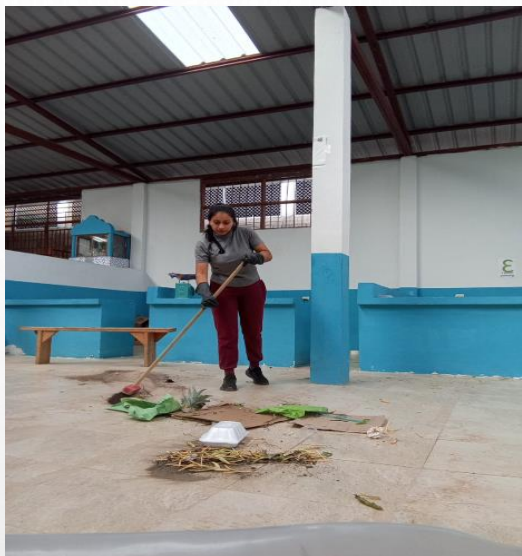
SPARK SOC 2025.12.16 15:24 27mm 1/2 1/120s ISO105