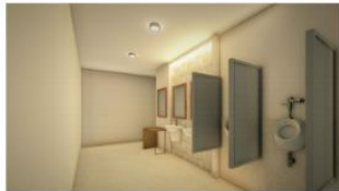
perspectiva baño caballeros