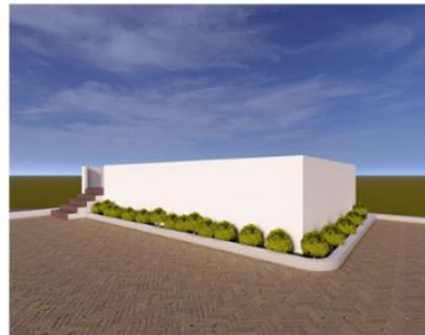
perspectiva area cubierta