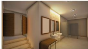
perspectiva baño caballeros