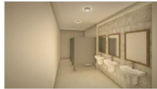
perspectiva baño damas