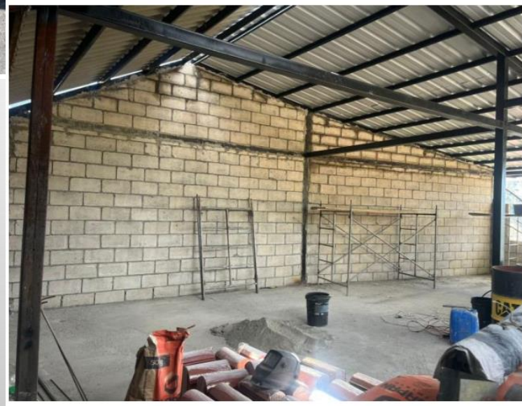
1.9 CUBIERTA DE ASBESTO CEMENTO - 8' (INC. ACCESORIOS SIN CUMBRERO)