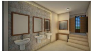
perspectiva baño damas